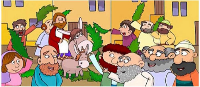
Jesus zieht an Palmsonntag in Jerusalem ein.

An Palmsonntag ritt Jesus auf einem Esel nach Jerusalem. Denn dort gibt es jedes Jahr – bis heute! – ein besonderes Fest für Juden. Es nennt sich das Pascha-Fest. Zu dieser Feier kommen viele Juden nach Jerusalem. Dort wollen sie gemeinsam ihren Glauben feiern. Und weil Jesus selbst auch Jude war, wollte er mitfeiern.