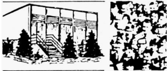
Das Motiv auf dem Kopf des Gemeindebriefs –

Wenig später wurde in Reichenbach ein Kapellenwagen mit Zelt aufgestellt, so dass Gottesdienste und andere Veranstaltungen vor Ort stattfinden konnten. Das Gelände dafür war ein mitten in Reichen-