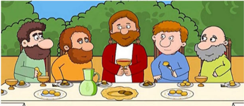
Jesus isst an Gründonnerstag zusammen mit seinen Aposteln.

Die Leute dort freuten sich sehr darüber, dass Jesus zu ihnen gekommen war. Sie hatten davon gehört, dass er schon vielen armen und kranken Menschen geholfen und Wunder bewirkt hatte. Deshalb sahen sie ihn als ihren Retter an. "Gesegnet sei er, der kommt im Namen des Herrn!", riefen sie. Die Leute legten Kleidung und Palmzweige für ihn auf den Boden, um Jesus zu ehren. Die Stadtoberhäupter hörten von dem Mann, den alle verehrten. Ihnen machte es Angst, dass ihr Volk Jesus wie einen König feierte. Deshalb wollten sie Jesus umbringen.