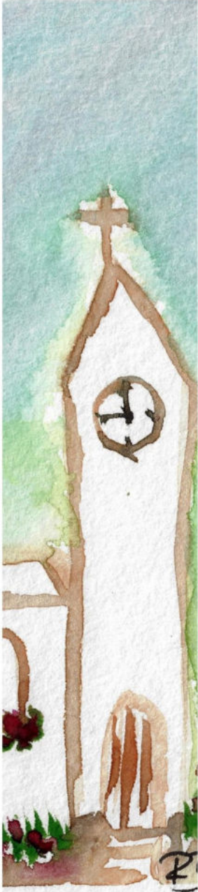
Aquarell: Romina Becker

Noch nie hat uns unser Gemeindezentrum so beschäftigt, wie in den letzten Jahren. Natürlich, letztthin war es 40 Jahre her, dass ein Landesbischof den Segen über das neue Haus sprach. Aber schon 30 Jahre danach musste man sich Gedanken darüber machen, ob angesichts des zurückgegangenen Gemeindelebens das Gemeindezentrum nicht zu groß ist und nach eingehender Prüfung machte man sich mit dem Gedanken vertraut, Jugendhaus und Türmchen abzureißen. Zurück blieb ein Torso des ursprünglich mit so vielen guten Ideen geplanten Gebäudeensembles. Die kürzlich fertiggestellte, liebevoll gestaltete Außenanlage ist der Versuch, die Wunden des Abrisses ein wenig zu heilen.