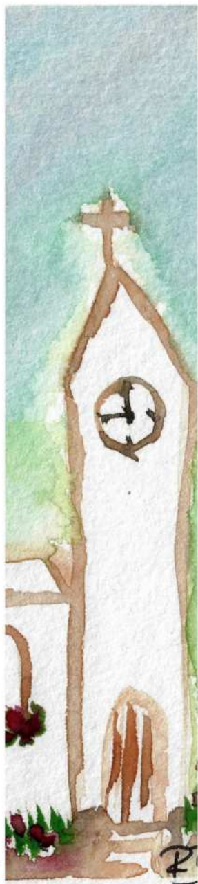
Aquarell: Romina Becker

Wir bauen Kirchen in unsere Welt, das fällt uns leicht, sie sollen bezeugen, dass Gott bei uns wohnt. Doch selber zu zeigen, wie nahe Gott ist, das fällt uns schwer, so bauen wir Kirchen in unsere Welt, manchmal zu groß.