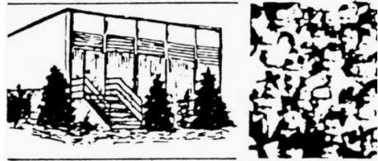
Das Motiv auf dem Kopf des Gemeindebriefs –

Es fiel somit Pfarrer Blankenfeld zu, den Bau eines neuen Gemeindezentrums zu begleiten, das im Oktober 1984 einge-