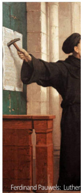
Ferdinand Pauwels: Luther

Auch in der Markgrafschaft Baden gab es erste Ansätze einer kirchlichen Reformati-