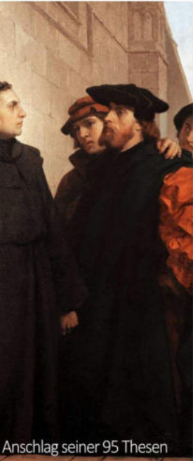
Anschlag seiner 95 Thesen

Während in der Markgrafschaft Baden-Durlach 1556 die Reformation nach Württemberger Vorbild eingeführt wurde, verlief in der Markgrafschaft Baden-Baden die Religionspolitik wechselhaft. Hatte man die bis 1536 sich weitgehend ungehindert ausbreitende protestantische Bewegung vergeblich versucht, zu ersticken, führte Markgraf Philipp wiederum ab 1556 die Reformation faktisch durch, ohne allerdings das Lutherum zum verbindlichen Landesbekenntnis zu machen. Nach seinem Tod aber setzte bis 1588 unter Philipp II. eine erste konsequente Reka-