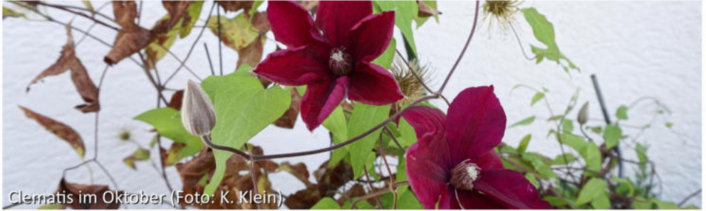
Clematis im Oktober

Textabschnitte aus: „Momente, die dem Himmel gehören“. Verlag am Birnbach, 2021.